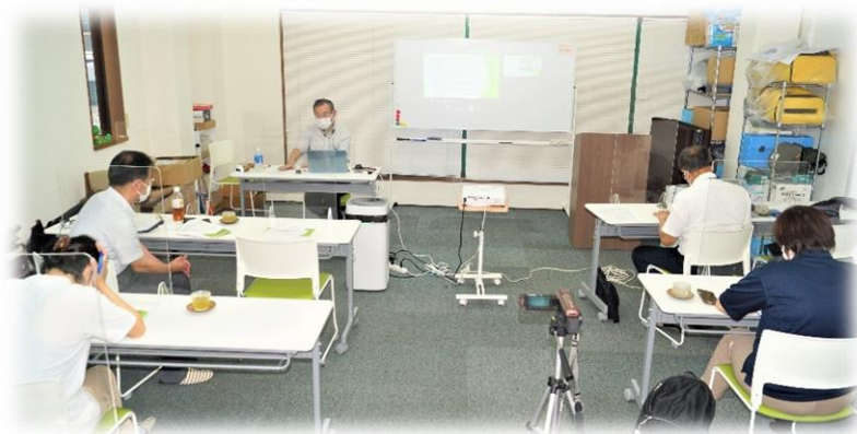
↑ CREDO介護福祉学院にて、対面講義を実施。 (ZOOM録画 及び YouTube配信用カメラにて同時撮影)