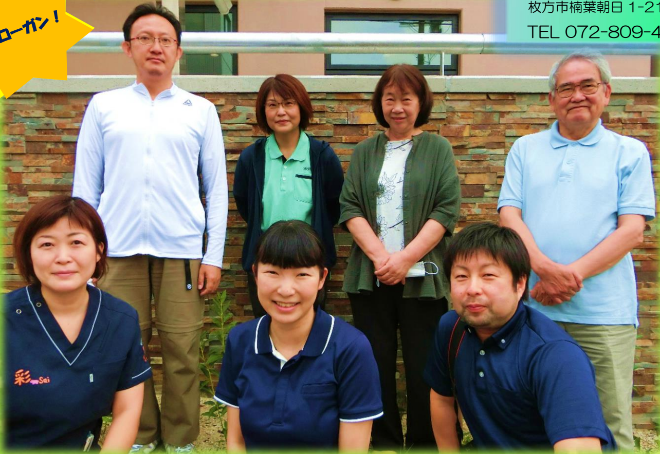
2021年度 新役員メンバー集合写真（枚方市保健センター前にて）