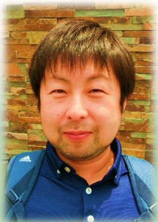
会長 一般社団法人 CREDO