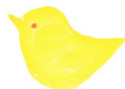
顧問 枚方市役所 健康福祉部 健康寿命推進室 健康づくり・介護予防課 南尾 安寿小