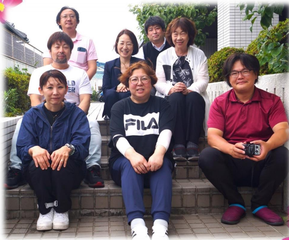
2023 年度新役員 枚方市保健センター前にて